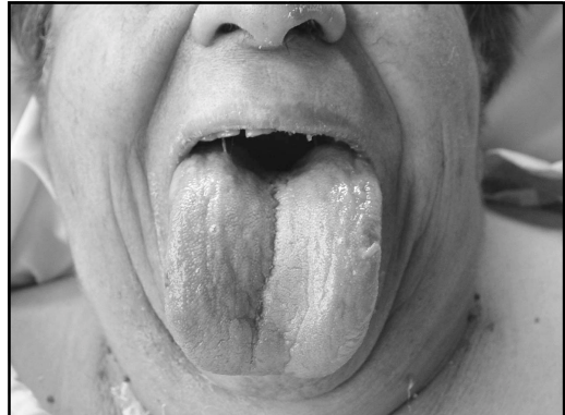
Figura 2. Angioedema postratamiento.

angioedema luego de la indicación de suspender el enalapril. Llama la atención que en dos de los casos, constaba en la historia clínica en sus controles de hipertensión arterial crónica, la presencia de angioedema recurrente leve, sin haberse suspendido el medicamento.