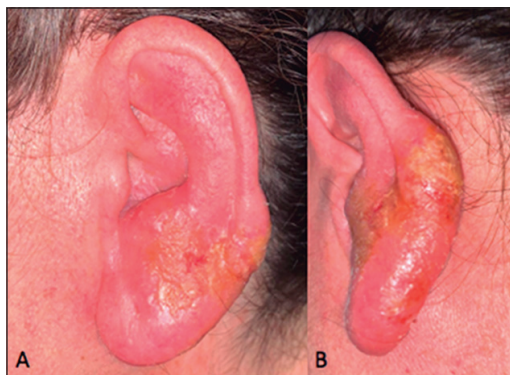
Figura 1. Imagen del pabellón auricular. Se objetiva pabellón auricular izquierdo aumentado de tamaño con respecto a pabellón auricular derecho. Presenta eritema y edema en toda su extensión, exudación amarillenta en región del lóbulo (A) y tercio medio inferior de hélix (B).

Se completó el estudio con análisis sanguíneo, que no evidenció alteraciones ni en el hemograma ni en la bioquímica, y la serología para leishmania y virus de inmunodeficiencia humano fue negativa. Se realizó un electrocardiograma que no evidenció alteraciones del QT, ni arritmias y una ecografía abdominal no patológica. Con estos resultados, el diagnóstico fue de leishmania cutánea de características erisipeloides. Cumpliendo con los criterios de tratamiento sistémico (localización compleja, afectación > 3 cm), se le propuso tratamiento con antimonio de meglumina sistémico, que fue rechazado por la paciente al requerir ingreso. Se inició, por lo tanto, fluconazol 200 mg/día durante 6 semanas, consiguiendo una gran mejoría y disminución del dolor, pero no su resolución (Figura 2A). Tras la disminución del edema y la extensión de la afectación, se planteó tratamiento intralesional con antimonio de meglumina. Tras dos infiltraciones, separadas cada una de ellas por dos semanas, se consiguió completa resolución (Figura 2B).